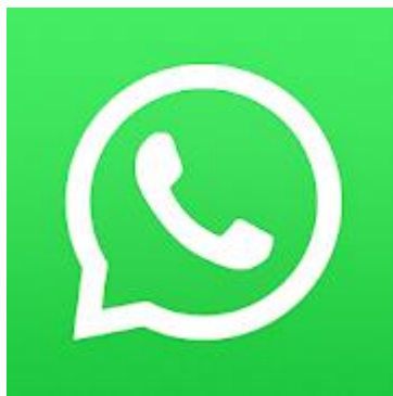
Obrázek 13: Logo WhatsApp [21]