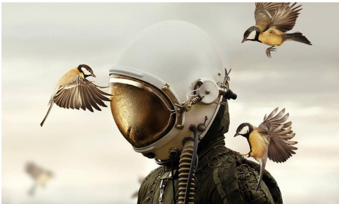
Obrázek 1: Dreamers and Warriors, Martin Stranka [43]

2014. Toto dílo znázorňuje níže obrázek 2 [44]. Následovaly jemu podobná díla, jako je například White Cosmonaut, který znázorňuje obrázek 3 níže. [45]