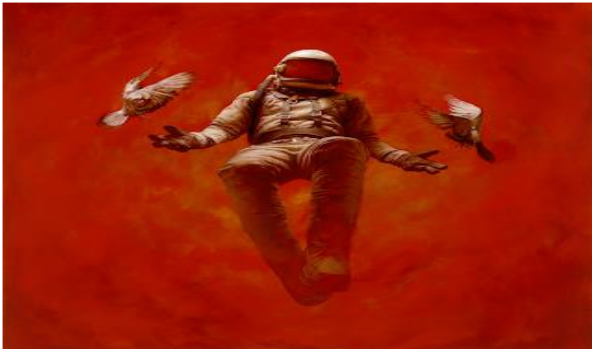
Obrázek 2: Hypostasis, Jeremy Geddes [44]