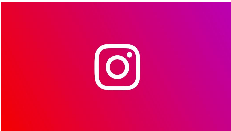
Obrázek 12: Logo Instagramu [20]

Instagram je americká sociální síť, která se soustředí na zveřejňování fotografií a videa na předem vytvořeném profilu, podobně jako známější Facebook nebo Twitter. První vydání Instagramu, které se datuje k říjnu 2010, bylo původně určené pro mobily iOS a na Android se dal instalovat až o dva a půl roku později. Logo Instagramu můžeme vidět na obrázku 12 níže.