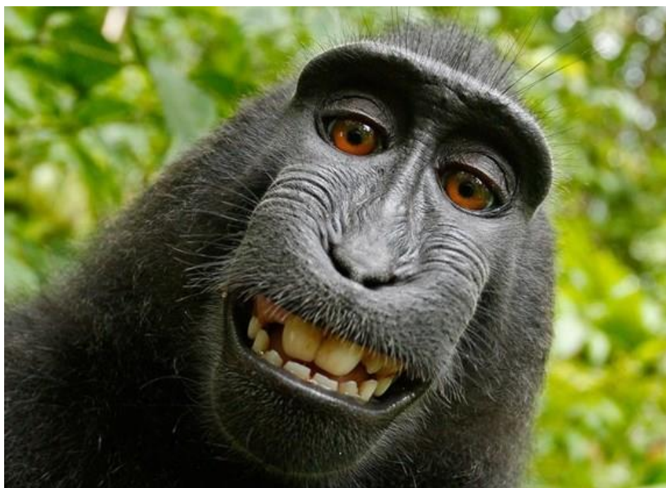
Obrázek 8: Selfie opice [52]