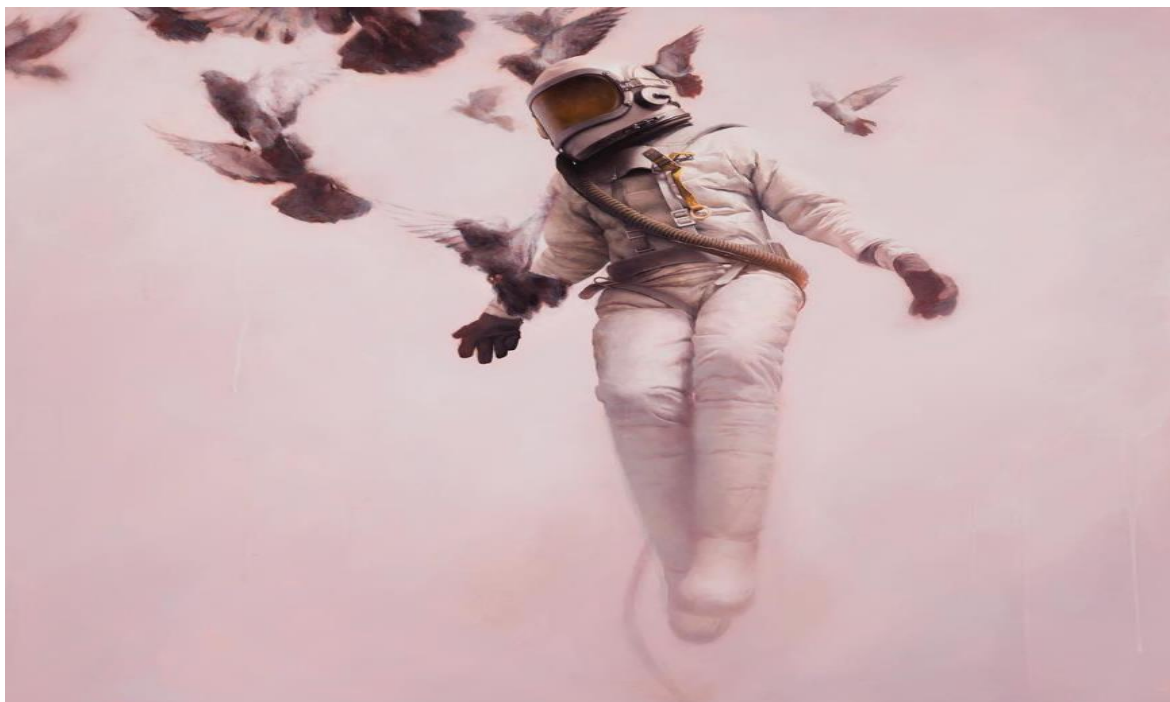
Obrázek 3: White Cosmonaut, Jeremy Geddes [45]