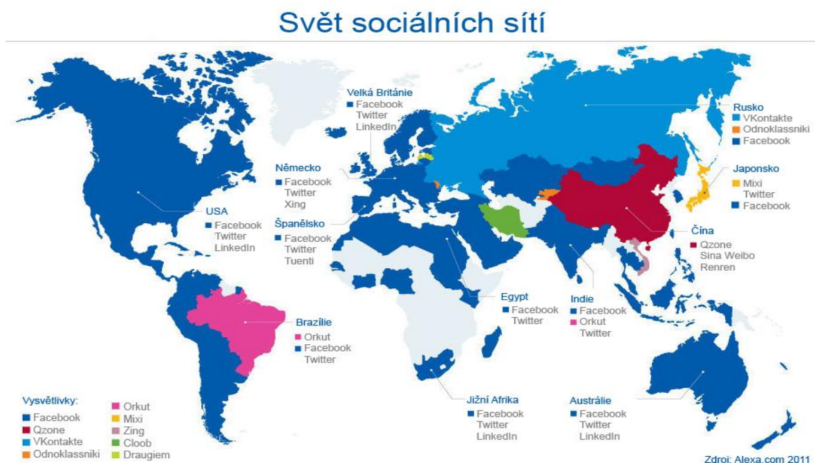
Obrázek 10: Oblíbenost sociálních sítí ve světě [74]

Sociální síť neboli social network je určitý virtuální prostor, kde můžeme komunikovat, sdílet videa, informace a fotografie. Přechodem na digitální svět se změnil i způsob sdílení všech věcí, které nás v životě obklopují. Běžně využívané aplikace si můžeme rozdělit podle účelu. Některé jsou vyloženě určené spíše k dlouhodobému ukládání a organizaci fotografií s případným sdílením a některé jsou určené především k rychlému sdílení fotografií. V současné době jako nejznámější a nejpopulárnější způsob pro rychlé sdílení fotografií jsou sociální sítě jako je Facebook, Flickr, Instagram, Pinterest, Snapchat, Twitter či WhatsApp. Obrázek 10 znázorňuje oblíbenost sociálních sítí v celém světě. [73]