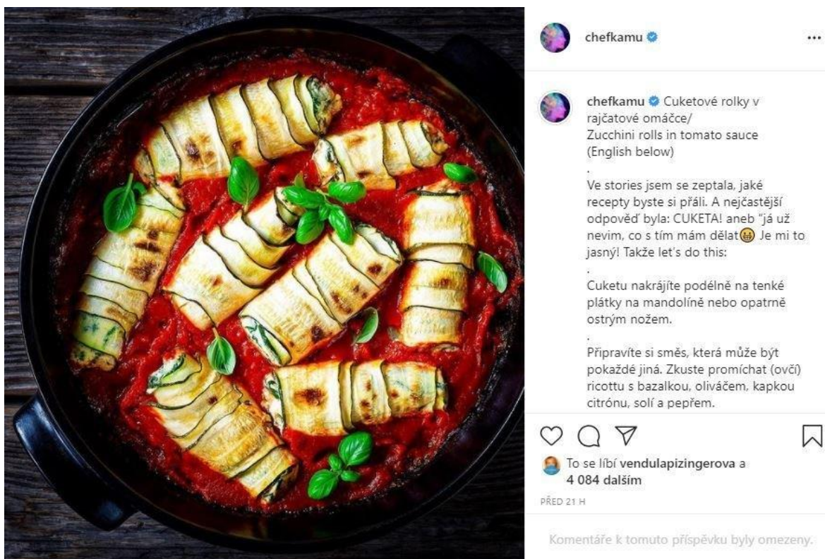
Obrázek 6: Fotografie zakoupená ve fotobance [48]

Další případ z nedávné doby se týkal známé kuchařky a cestovatelky Kamu (Kamila Rundusová). V nedávné minulosti Kamu čelila obvinění, že sdílela fotografii k jejímu prezentovanému receptu z fotobanky. Kamu se proslavila dvěma kuchařkami, a to Nejbarevnější kuchařka a Nejbarevnější Mexiko. Díky úspěchu těchto knih cestuje po celém světě. Kamu si vždy zakládala na fotografiích u svých receptů a fanoušky opravdu naštvávalo, že poslední snímek je koupený z fotobanky. Přišly reakce, které ji obvinily z toho, že snad i ostatní ilustrační fotografie jejich pokrmů jsou z fotobanky. Pod tlakem se Kamu přiznala, že tuto fotografii, kterou znázorňuje obrázek č. 6, koupila s licenci a se souhlasem autora za 100 USD. Na obhajobu uvedla, že fotografie zveřejňuje pro inspiraci. Také ve svém prohlášení upozornila na to své fanoušky, že nikdy nenapsala o zveřejněných fotografiích to, že je pořídila ona sama. Kuchařka Kamu i přesto, že neporušila žádná právní usnesení či zákon, tak pro své fanoušky už zůstane tou, která je klamala. Ke kauze je dobré uvést, že kuchařka Kamu pod tlakem okolí zmiňovanou fotografii stáhla ze svého Instagramu, a proto byla zde dohledána na portálu Blesk. [48]