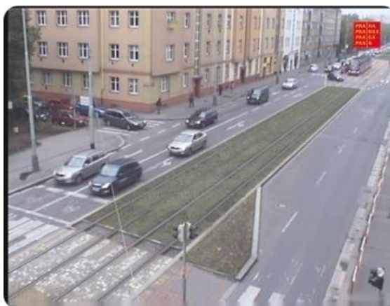
Obrázek 9: Provoz, kamera hl. m. Prahy v Černokostelecké ulici [59]

Fotografie, kterou nám znázorňuje obrázek 9 níže, byla pořízena při měření rychlosti dopravní kamerou a není považována za autorské dílo. Fotografii pořídil automat, proto nesplňuje zákonné podmínky pro duševní činnost. Odlišná situace bude u fotografie, která vypadá úplně stejně, ale byla pořízena fotografem se záměrem zachytit vzhled ulice. Taková fotografie již spadá pod autorský zákon, protože se na fotografii podílel autor, který použil duševní činnost při tvorbě a rozhodování, jak ulici vyfotografuje. [59]