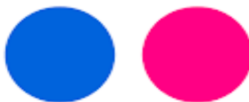
Obrázek 17: Logo Flickr [25]

Platforma Flickr byla vytvořena pro sdílení a nahrávání, organizaci a prezentaci fotografií. Logo Flickr můžeme najít na obrázku 17 níže.