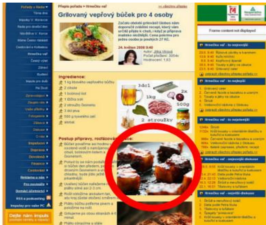
Obrázek 4: Ukradená fotografie pana Cuketky [46]