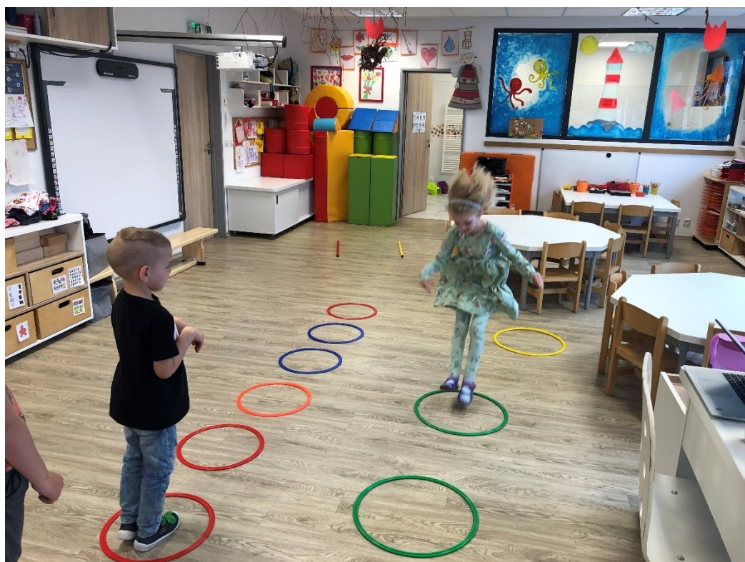
Obrázek 12 – Den šestý: Skáče jako klokan