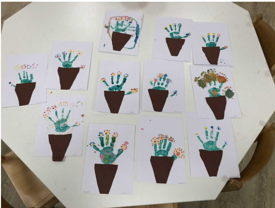
Obrázek 13 – Den šestý: Kaktusy z Austrálie