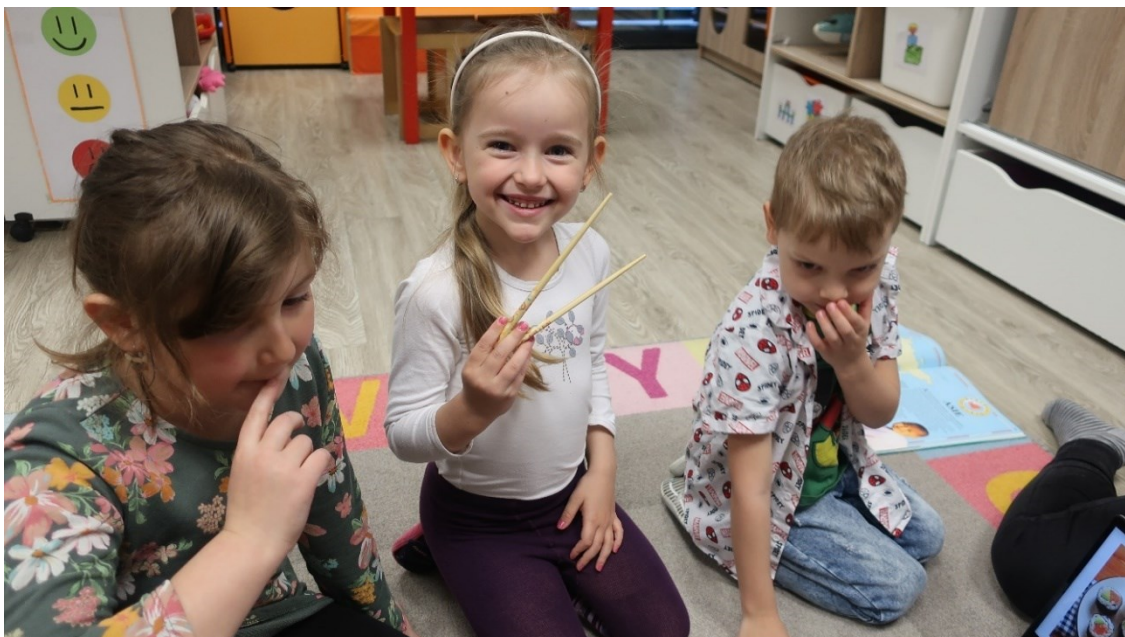
Obrázek 7 – Den třetí: Čínské hůlky