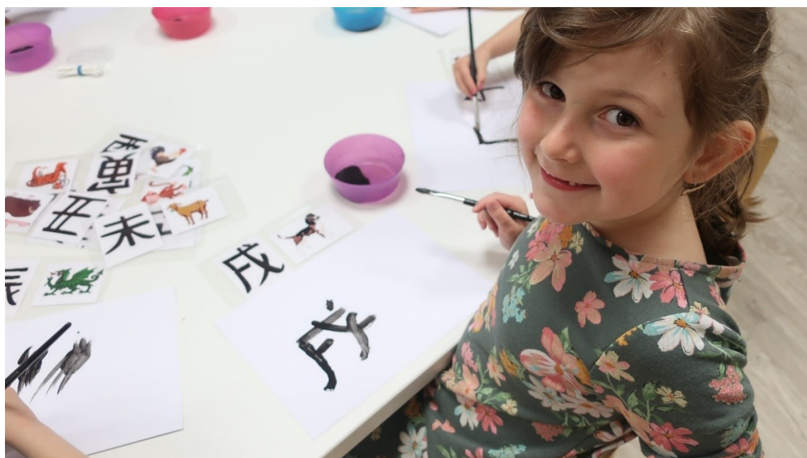
Obrázek 6 – Den třetí: Čínská kaligrafie