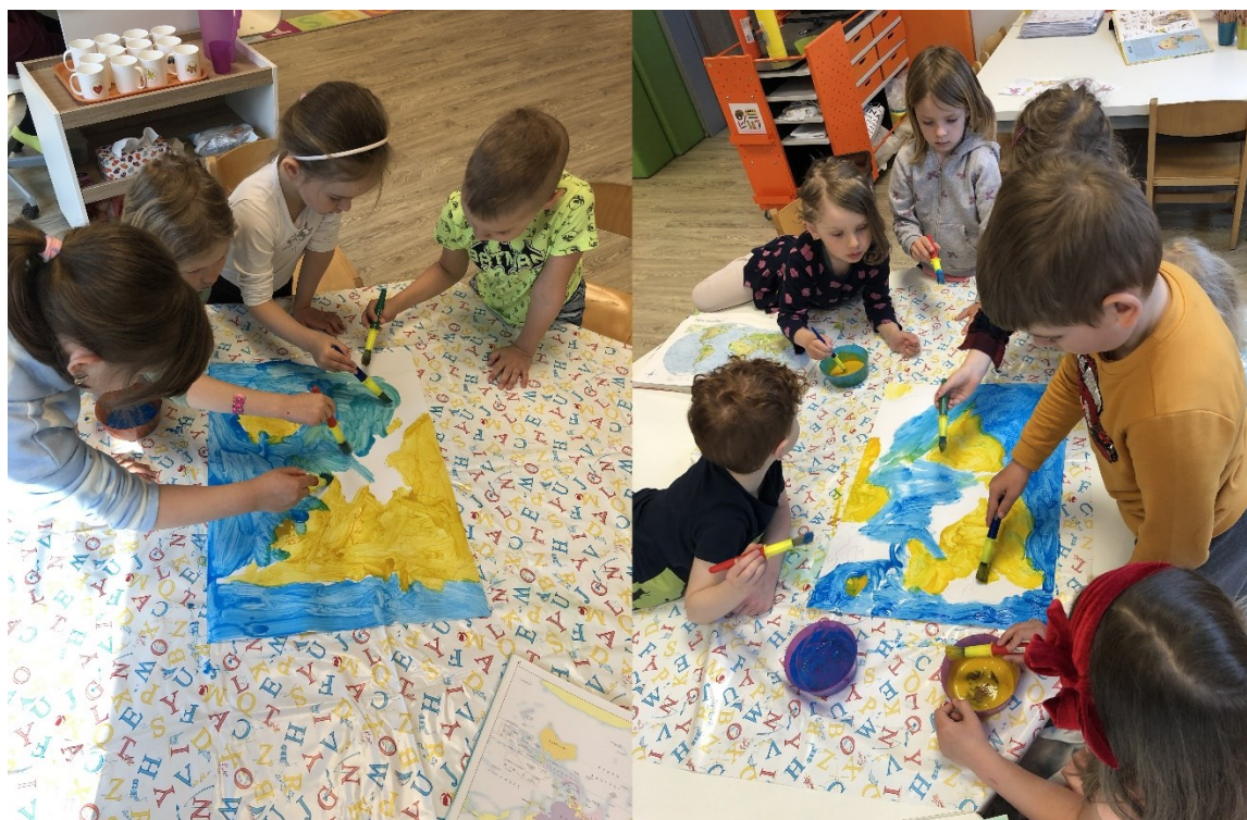
Obrázek 14 – Den sedmý: Výroba mapy světa