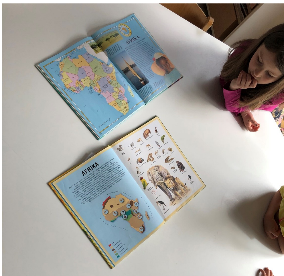
Obrázek 8 – Den čtvrtý: Poznáváme Africký kontinent