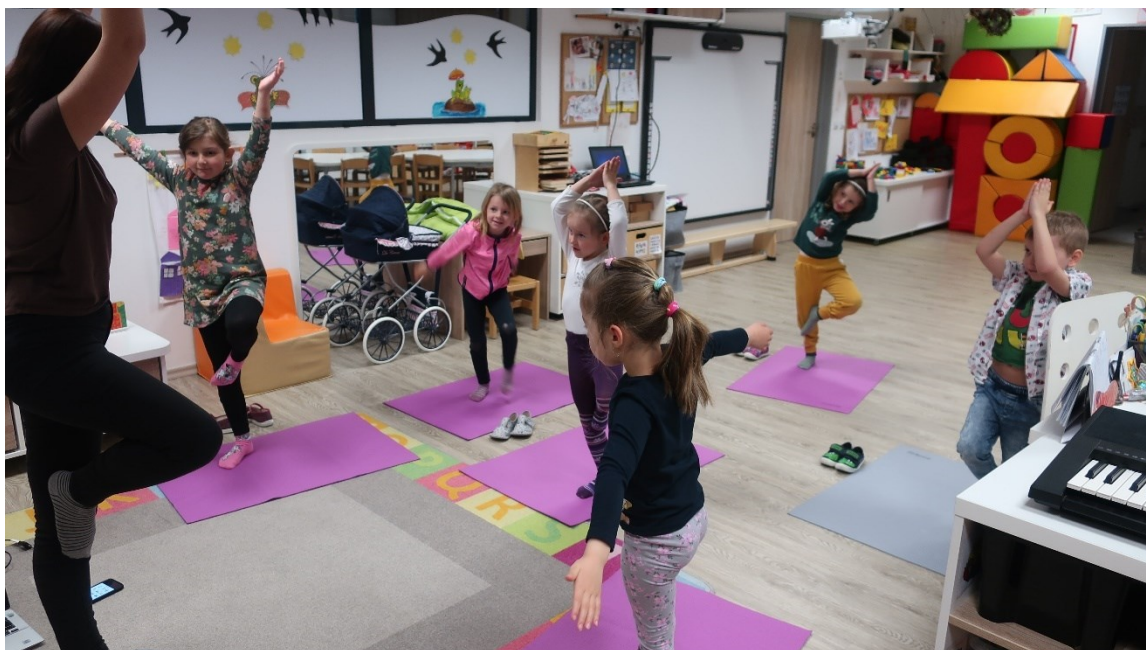
Obrázek 5 – Den třetí: Cvičení Jógy