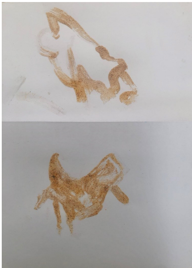
Obrázek 9 – Den čtvrtý: Písečné zvíře