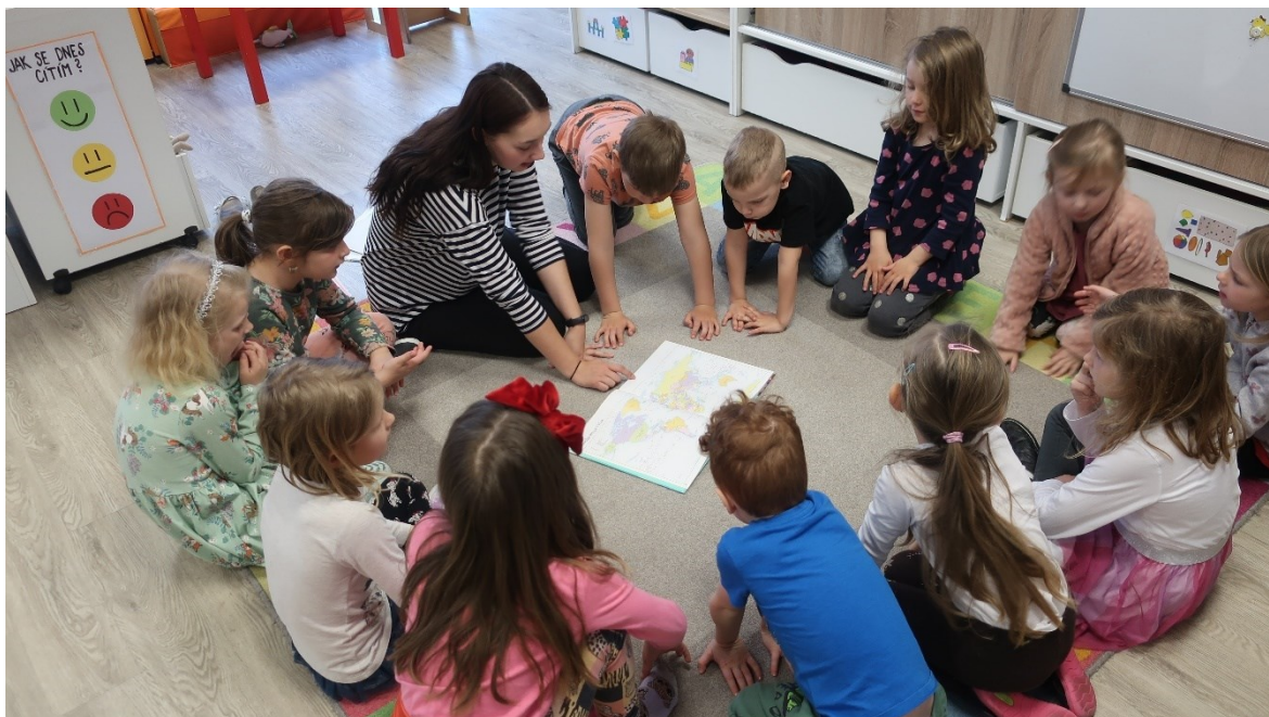
Obrázek 3 – Den první: Prohlížení atlasu světa