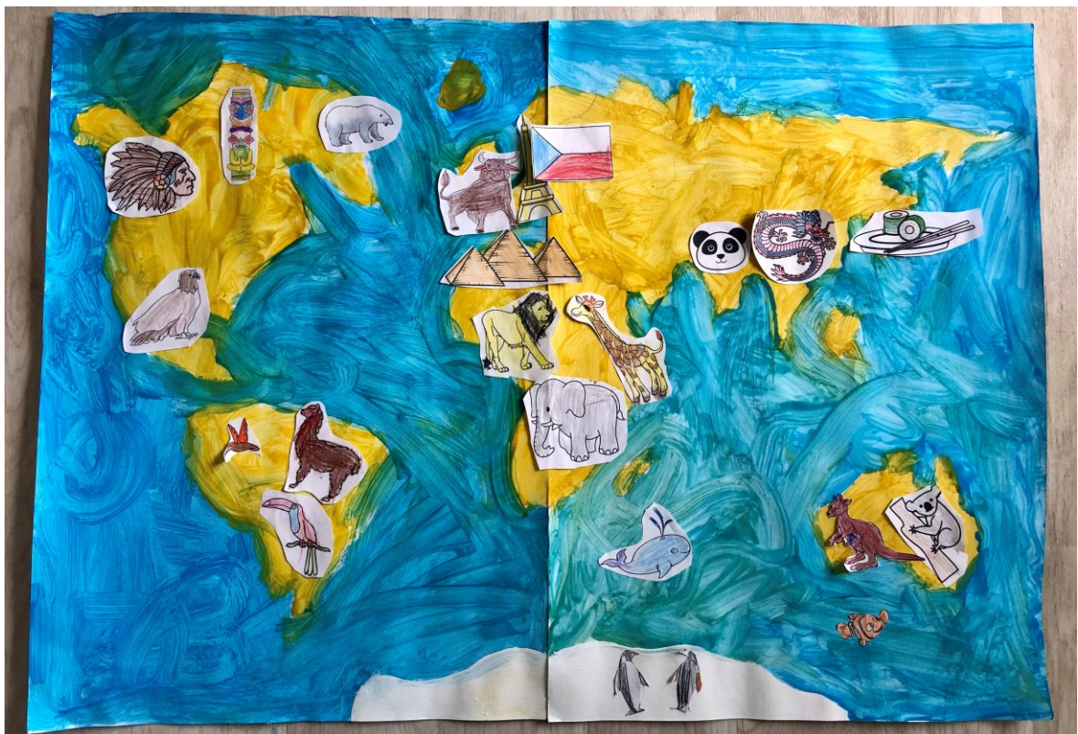
Obrázek 2 – Vytvořená mapa světa