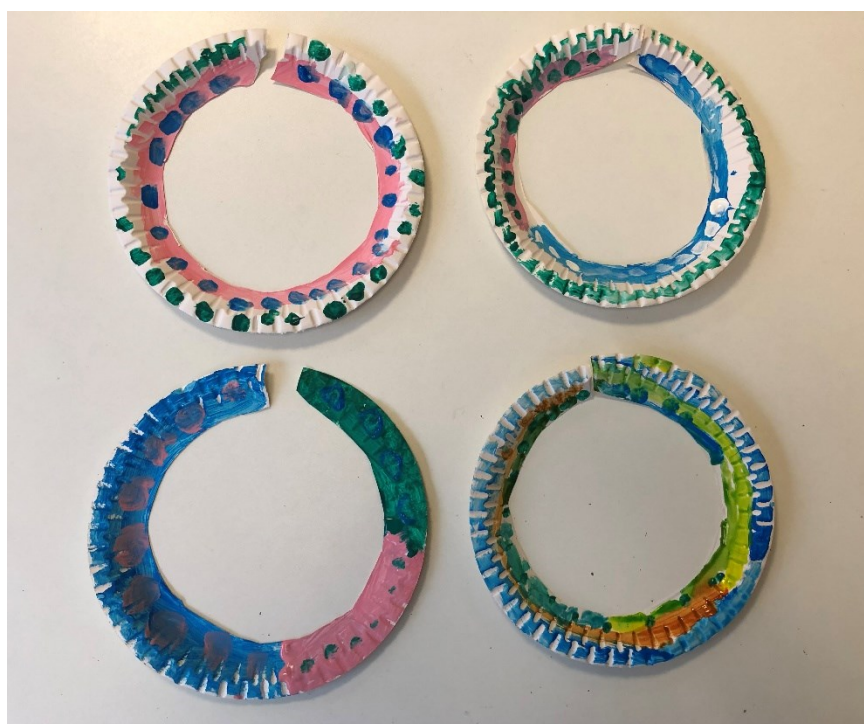
Obrázek 10 – Den čtvrtý: Africké náhrdelníky