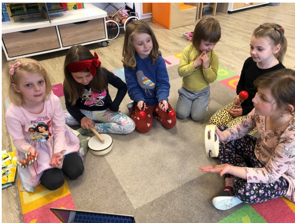
Obrázek 11 – Den pátý: Indiánská kapela