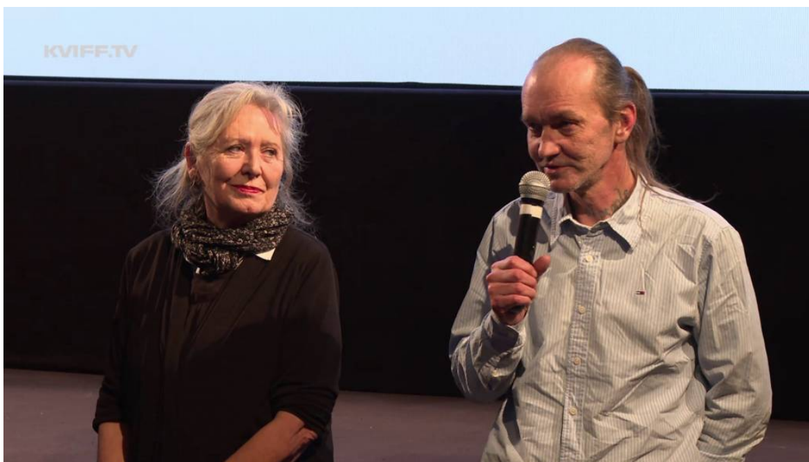
Obrázek 5 Premiéra filmu René – vězeň svobody 17