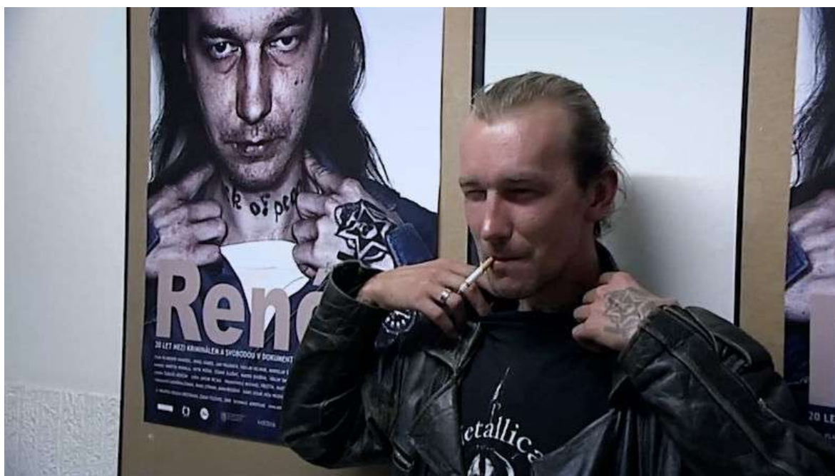
Obrázek 3 Premiéra filmu René 13

Časosběrný dokument René byl mimo jiné promítán v roce 2009 na festivalu Jeden svět, kde ho mohli spatřit i žáci a mladí studenti jako pedagogický příklad toho, jak můžou svým nedobrým jednáním skončit. Film byl ukázkou toho, jak by se ani vulgárně neměli chovat, a aby si z projekce filmu celkově odnesli ponaučení.