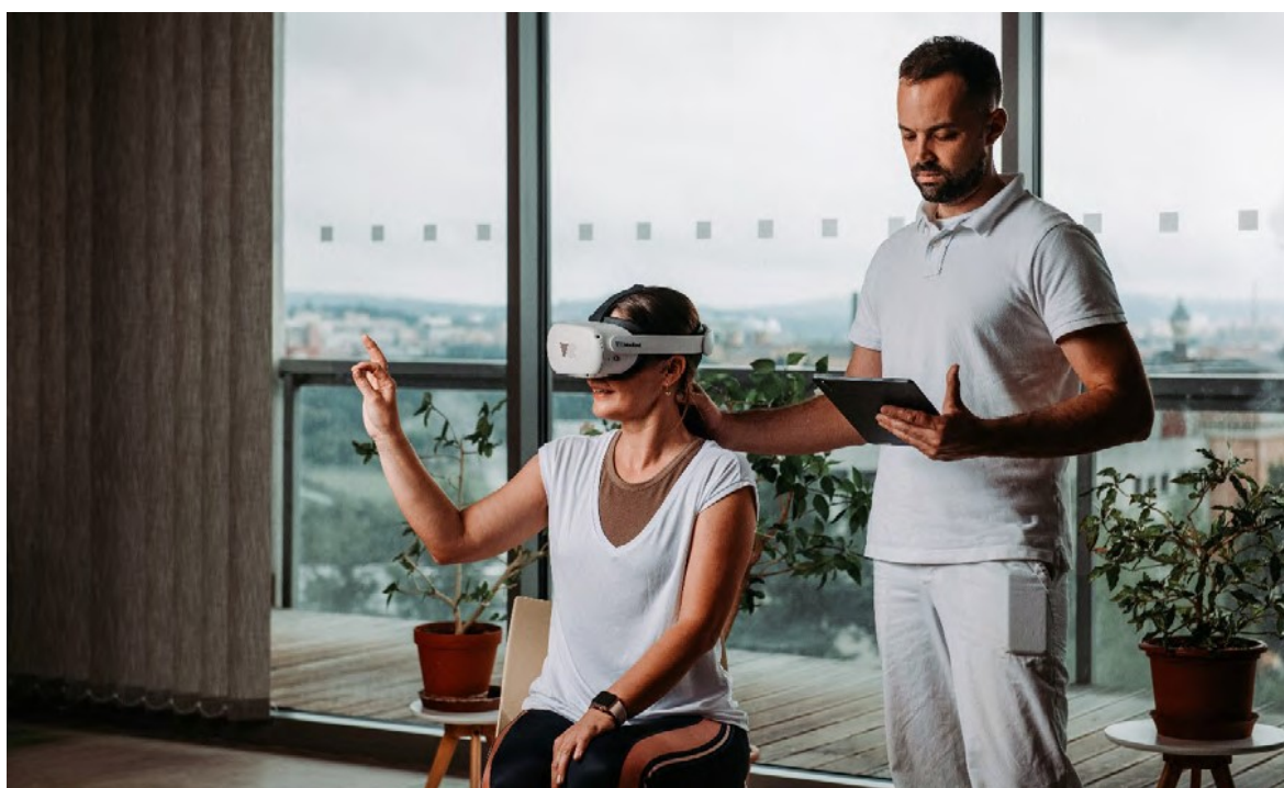
Obrázek 6: Testování VR 34

Institut lázeňství a balneologie ve spolupráci s VR Medical pokračuje v pilotním projektu zaměřeném na využití aplikace virtuální reality (VR) v rámci třítydenního komplexního lázeňského pobytu. Cílem tohoto projektu je ověřit vhodnost a účinnost použití VR technologie jako součásti lázeňské terapie. Společnost VR Medical je držitelem certifikace Medical Device Class 1, kterou udělil Státní úřad pro kontrolu léčiv (SÚKL), a platí nejen v České republice, ale i v celé Evropské unii. 33