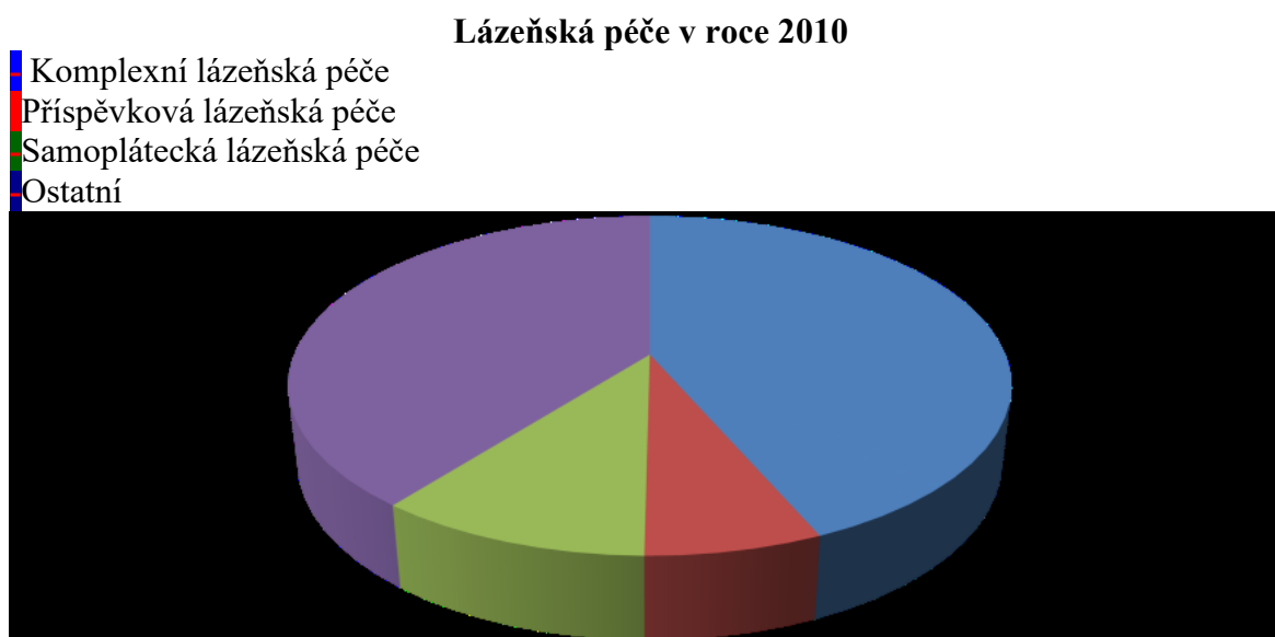
Obrázek 2: Porovnání zastoupení druhů lázeňské péče v ČR v roce 2010

Samoplátecká lázeňská péče není vázána návrhem ani jakýmkoliv jiným doporučením. Zájemce si veškeré náklady financuje sám, objednávku k pobytu a léčení si zasílá na obchodní oddělení lázeňského zařízení rovněž sám. 11