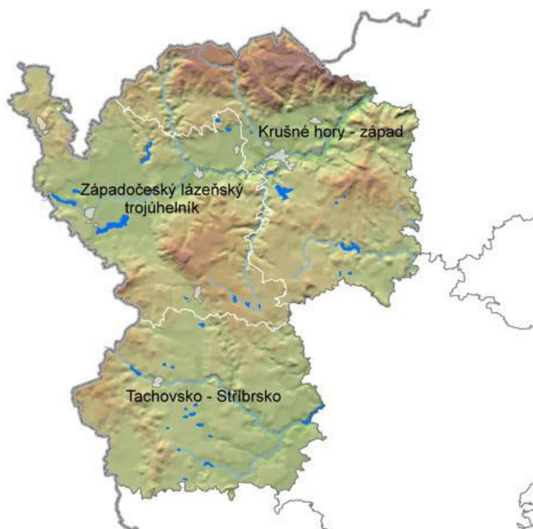
Obrázek 5: Západočeský lázeňský trojúhelník 29

„Západočeský lázeňský trojúhelník se nachází na okraji Slavkovského lesa, kde doznívající vulkanickou činností provázel vznik minerálních pramenů, které učinily západočeský region světoznámým.“ V čele lázeňského trojúhelníku stojí město Karlovy Vary, které založil Karel IV. ve druhé polovině 14. století. Blahodárné účinky zdejších pramenů byly údajně známy už v 10. století, ale ke skutečnému rozkvětu lázeňství v tomto regionu došlo později, v 19. století. Na samotném konci 18. století byly založeny Františkovy Lázně, o pár desetiletí později pak Mariánské Lázně. Mezi menší lázeňská města v této oblasti patří také Lázně Kynžvart, Jáchymov a Konstantinovy Lázně. 28