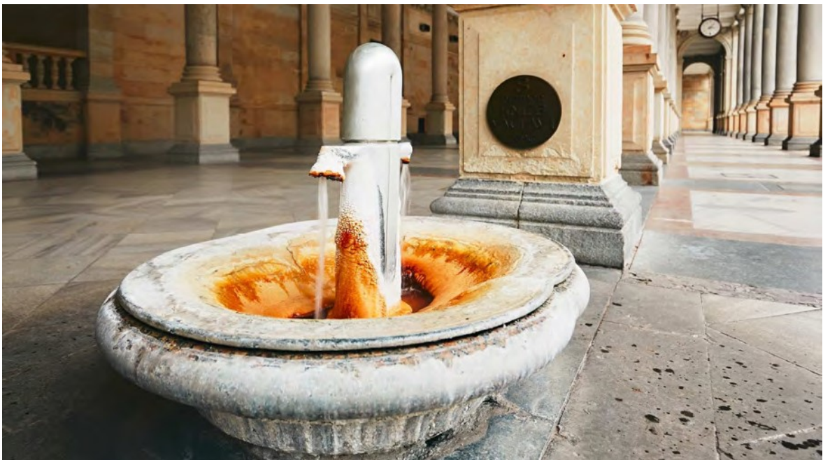
Obrázek 1: Pramen 6 - Mlýnský pramen, Karlovy Vary

„Přítomnost pramenů dala vzniknout významným lázeňským stavbám, které jsou označovány jako kolonády. Je to např. Sadová kolonáda s 3 prameny, Mlýnská kolonáda s 5 prameny, Tržní kolonáda postavená ve švýcarském stylu s 2 prameny, Zámecká kolonáda se Zámeckým pramenem, který je sveden do dvou váz, a Vřídelní kolonáda, v jejichž prostorách je umístěno celkem 5 nádob s vřídelní vodou o teplotách 72, 57 a 41° C. Sloupec vřídelní vody je díky tlaku schopen vytrysknout až do výšky 12 metrů.“ 6