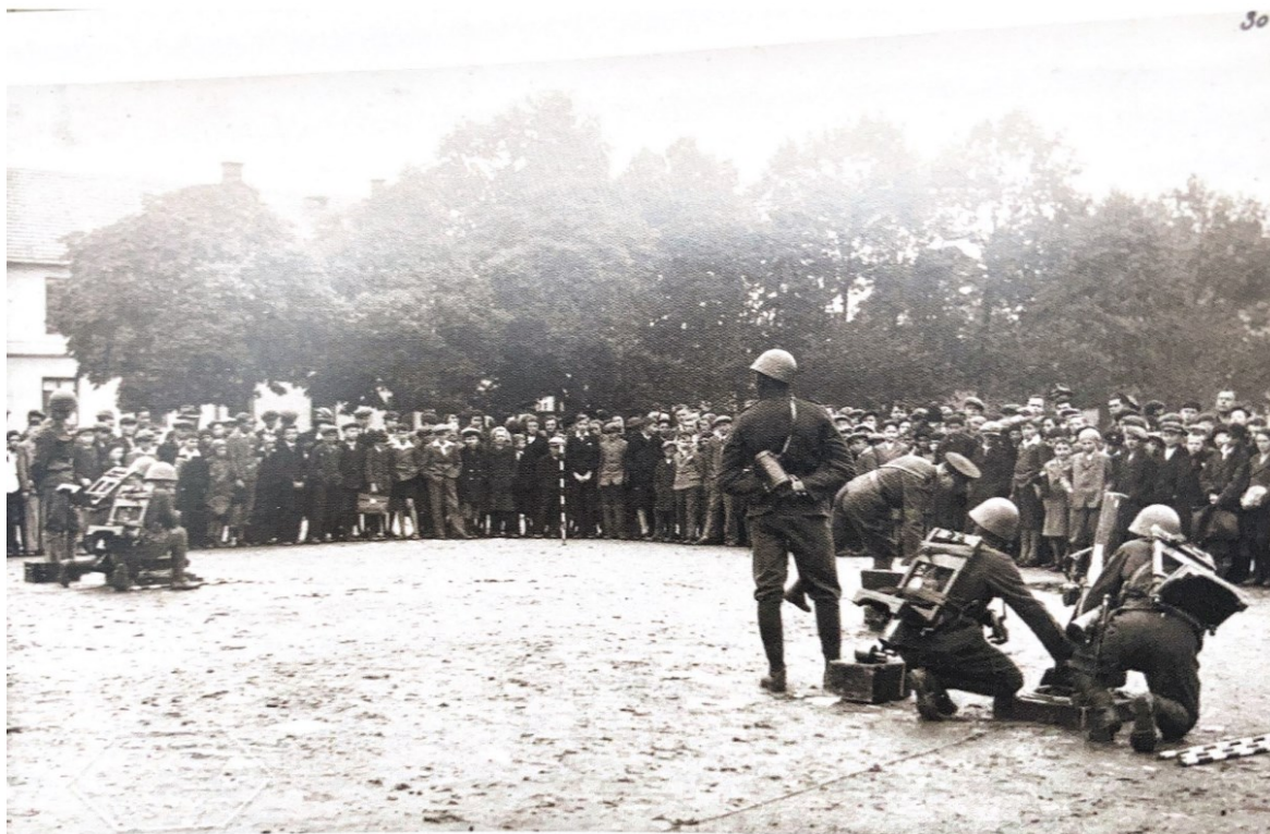
Obrázek 2 Den brannosti v Berouně v roce 1936

Pak následoval program, který zahrnoval sborový zpěv národních písní a ukázky společného cvičení žactva, odpoledne probíhaly sportovní závody a hry, při kterých byl kladen důraz na týmovou spolupráci. (Šimek, 2021)