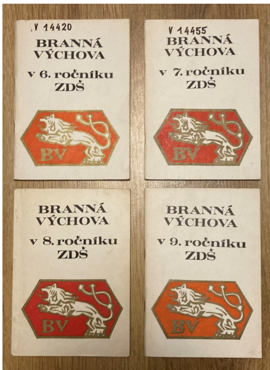
Obrázek 4 učebnice Branné výchovy

V minulosti branná výchova byla jako povinný předmět na základních školách a vyučovala se na druhém stupni od školního ročníku 1974/75. Učebnice, které se v těch letech využívaly se jmenují Branná výchova v 6. ročníku ZDŠ, Branná výchova v 7. ročníku ZDŠ, Branná výchova v 8. ročníku ZDŠ, Branná výchova v 9. ročníku ZDŠ. Od školního roku 1976–1977 se branná výchova vyučovala na druhém stupni v 7. a 8. ročníku, avšak rozsah branného učiva se tím nezměnil. (Horvát, 1975) Viz tabulka č. 2