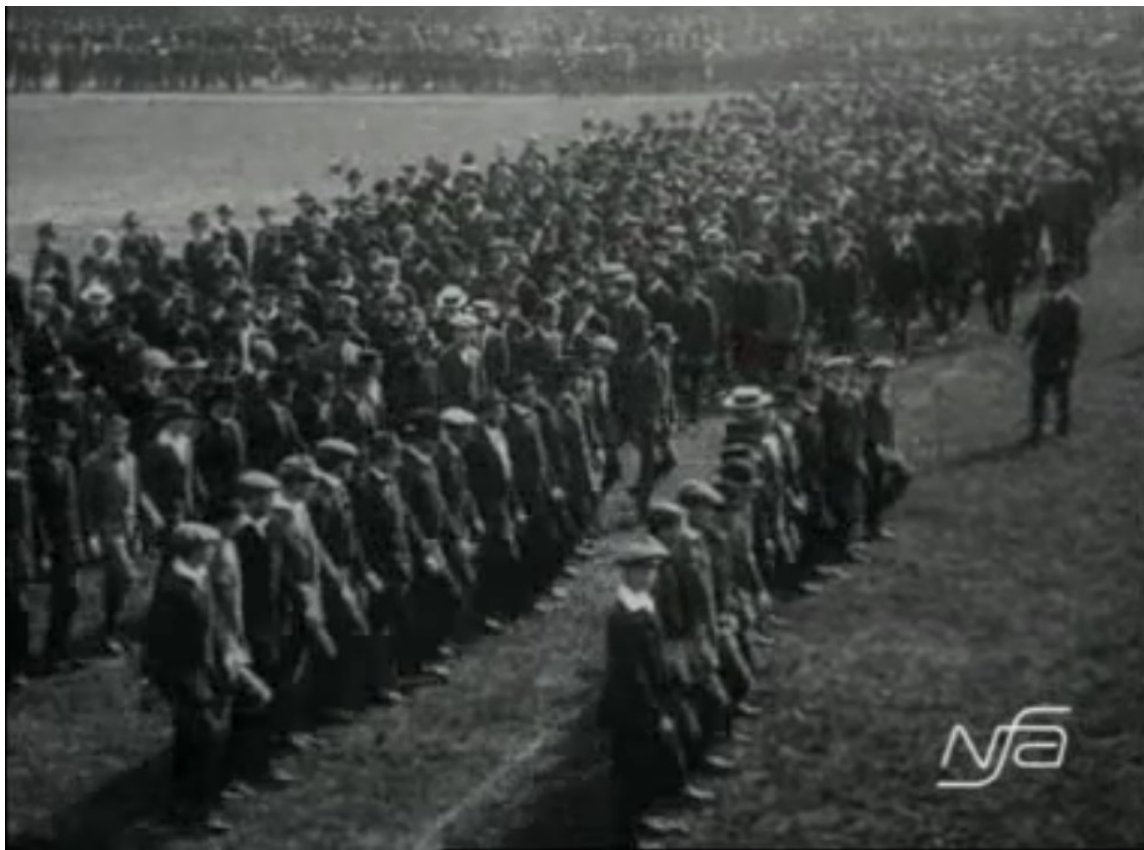
Obrázek 1 Slavnostní cvičení Junobraný

Poté co v roce 1918 vzniklo Československo, tak se vážně uvažovalo o reformě vzdělávacího systému, ta se nakonec neuskutečnila, avšak byl přijat zákon č. 226/1922 Sb., který měnil a doplňoval zákon o školách obecných a občanských. Na základě tohoto zákona se do škol povinně zaváděla výuka předmětu občanská nauka a výchova, ten v pozdějších letech úzce souvisel s brannou výchovou. Díky tomuto předmětu byla školní mládež poučena o fungování státu a seznámena s principy republikánského státního zřízení. Branná výchova v rámci tělesné přípravy a předvojenského výcviku, tak jak byla známa za monarchie, měla být dle československých vojenských úřadů obnovena, avšak ke spolupráci mezi armádou a dobrovolnými oddíly, které byly složeny ze členů tělovýchovných organizací, nedošlo, protože mezi oběma stranami se nepodařilo dosáhnout shody. Navzdory tomu připravil Hlavní štáb armády v roce 1925 návrh zákona, který stanovoval povinnou brannou výchovu pro všechny muže od 18 let a průběh výcviku ve speciálních střediscích. O dva roky později byl zákon projednáván v parlamentu, avšak kvůli nedostatečné podpoře byl zamítnutý už v prvním čtení. Poté na chvíli snaha o zákonné ukotvení branné výchovy ustala a v následujících letech zůstávala pouze na dobrovolných organizacích. Hlavně tedy