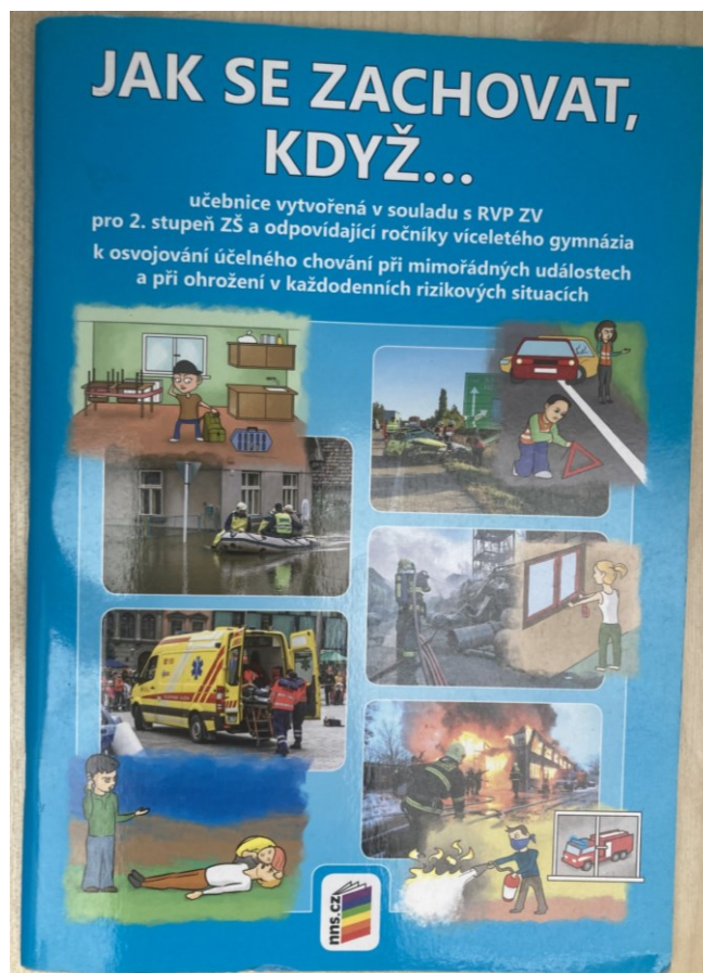
Obrázek 6 učebnice Jak se zachovat, když... (Vlastní, 2024)

Příprava občanů k obraně státu je rozdělena do několika témat: ochrana státu, bezpečnostní prostředí, bezpečnost jako záruka prosperity, zapojení České republiky do mezinárodních organizací a jeho význam pro bezpečnost státu, bezpečnostní systém České republiky, krizové stavy, ozbrojené síly a Armáda České republiky, humanitární mise a vojenské operace v zahraničí, právní aspekty válečných konfliktů, vojenská činná služba, záloha ozbrojených sil a branná povinnost. Na školách je plánována tak, aby se v rámci jednotlivých vzdělávacích oborů podporovalo občanské a právní uvědomění žáků, posilovalo jejich smysl pro občanskou i osobní zodpovědnost a motivovalo je k aktivnímu a kvalitnímu životu v demokratické společnosti. U žáků je formován pozitivní systém hodnot, který je založen na historických zkušenostech a ovlivňován jejich postoj k obraně státu a ochraně zdraví, životů, majetku a životního prostředí během vojenských krizových situacích. Vyučování je přizpůsobeno věku konkrétních skupin. Důležité znalosti, schopnosti, dovednosti, postoje a hodnoty pro osobní rozvoj jednotlivce v oblasti přípravy občanů k obraně státu, které jsou získány na základní škole jsou poté rozvíjeny během středoškolského vzdělávání. (Gerhát, 2019)