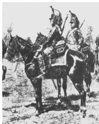
obr. č. 11 Kyrýsník 5. pluku