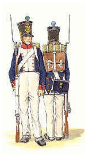
obr. č. 8 Uniforma pěchoty

Typická barva sukna francouzské armády byla modrá. V roce 1815 se zpravidla oblékal krátký modrý frak do pasu se dvěma řadami knoflíků. Další součástí oděvu byly bílé bandalíry, které nosili zkřížené na prsou a na kterých měli zavěšenou patronašku, bodák a popřípadě pěchotní šavli. Na hlavách nosili čáku (hranatá čepice) s mosaznou plaketou se symbolem druhu zbraně.