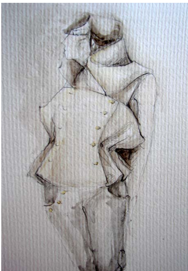
skica č. 4

K tomuto kabátci jsem vytvořila dlouhé volné kalhoty, které přesahují až přes boty. Abych zvýraznila \frac{3}{4} délku kalhot z období empíru, tak jsou nohavice od kolen dolů sešněrovány a vytváří tak čistou siluetu nohy.