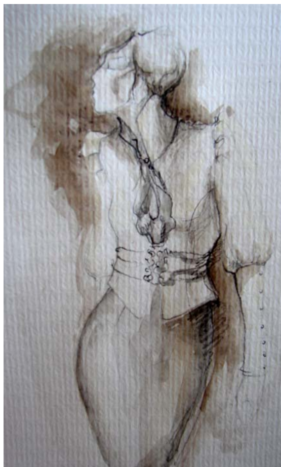
skica č. 6