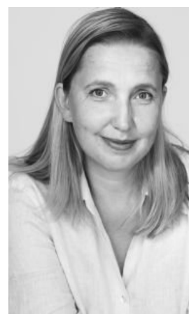
obr. č. 12 Hana Havelková

Česká designérka, držitelka mnoha předních ocenění, je svou špičkovou oděvní tvorbou velice populární doma i v zahraničí. Její oděvy jsou kultivované, s důrazem na kontinuitu, inovaci, osobnost a kvalitní design. Oblečení vyniká noblesou, špičkovým zpracováním i mimořádným citem pro elegantní křivky ženského těla. Tvorba Hany Havelkové zahrnuje originály, ale i malé oděvní série. Znamé jsou zejména její společenské modely a velké večerní róby.