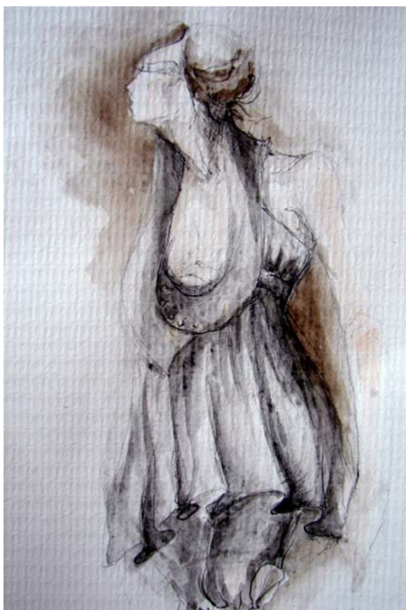
skica č. 3

Model jsem doplnila kalhotami s \frac{3}{4} délkou. I tady jsem využila řasení a manžetu na sepnutí nohavic.