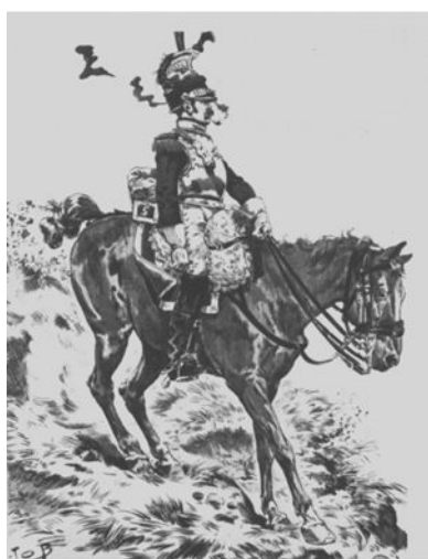
obr. č. 10 Francouzští dragouni