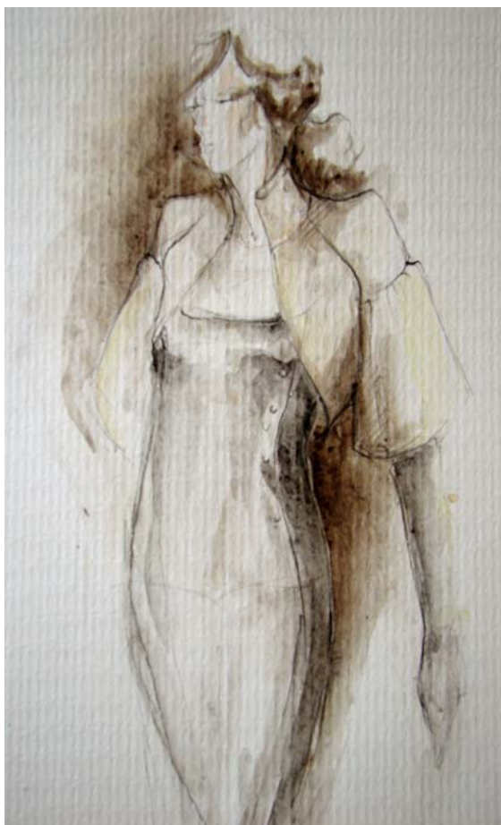
skica č. 5

Modely vycházejí z přísného vojenského řádu, upjatosti a příkazů, které značily, že voják musí poslouchat a nemá možnost vybočit z řady.