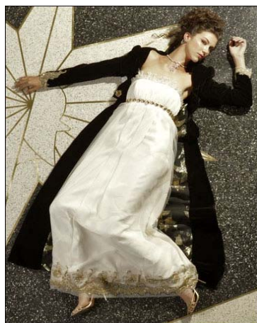
obr.č. 17 Šaty La Bohème od Ivonne de la Vega