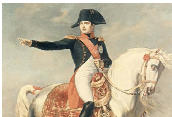
obr.č. 5,6 Oblíbená uniforma Napoleona Bonaparte