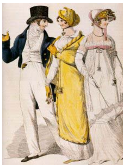
obr.č. 3,4 Oděv měšťanů