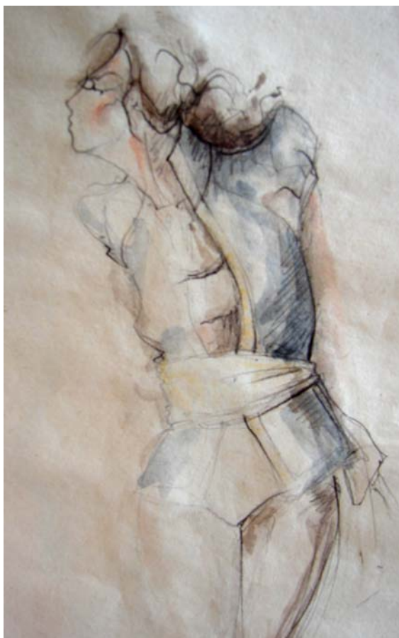
skica č. 1

Výsledkem jsou tři dvoudílné minimalistické modely. Dva se skládají z kabátku a overalu. Třetí je tvořen kabátkem a šortkami. Jsou pouze jakýmsi propojením ženského empírového oděvu s mužskou vojenskou uniformou.