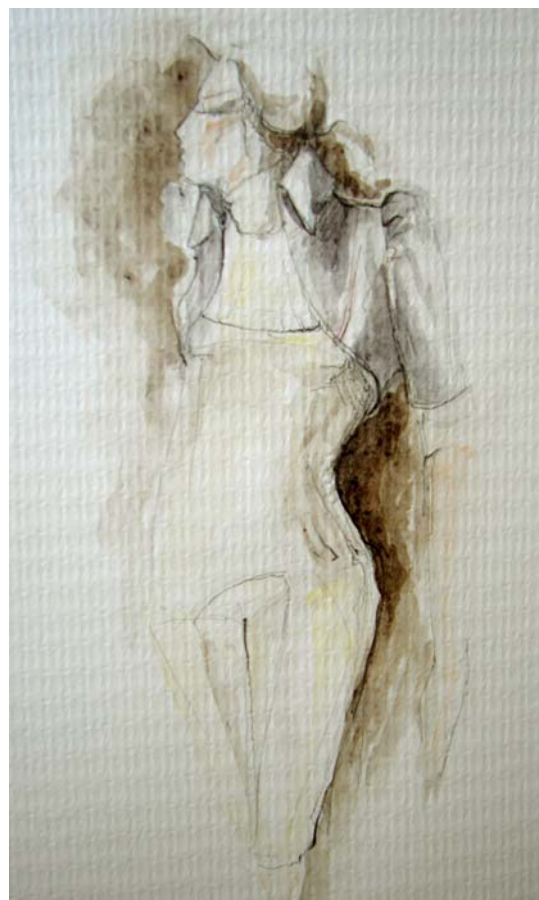
skica č. 2