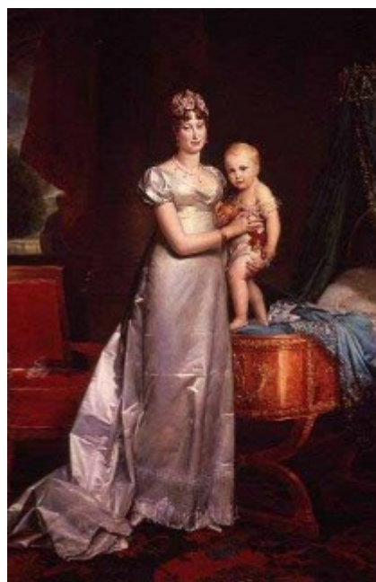
obr. č. 1,2 Typické empírové šaty

Na počátku měla sukně až skoro metr dlouhou vlečku, ale v průběhu dalších let se odstraňuje a postupně zkracuje. Také sukně se zkracuje a odhalují se boty. Po roce 1810 i kotníky. Do Paříže se začínají dovážet první kožešiny a pláště a pravé kašmírové šály. Móda je v tomto období propagována prvními módními časopisy: Journax , Gazettes et Revues , které vycházejí již od roku 1770.