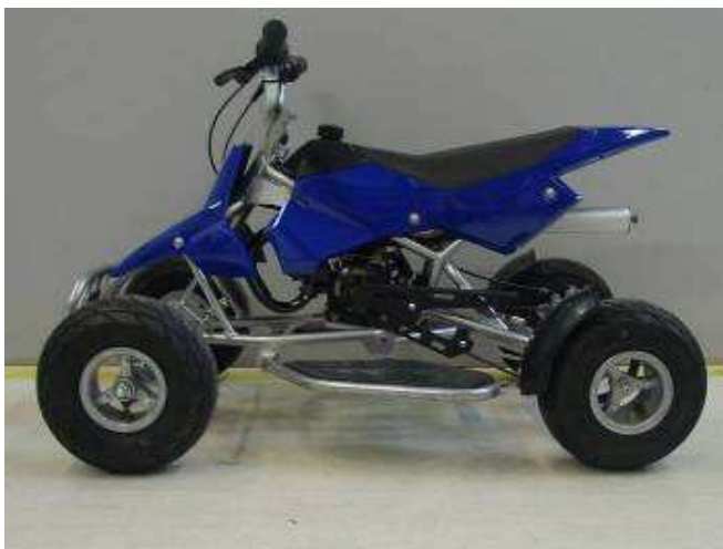
Nedovolená napodobenina – zadrženo v ČR