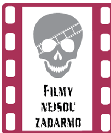
Obrázek 1: Logo kampaně "Filmy nejsou zadarmo"

Dalším důležitým článkem v prosazování práv z duševního vlastnictví, je chování vlastníků práv k duševnímu vlastnictví. Při vlastním vymáhání svých práv postupují různě. Jsou obchodní společnosti, které důsledně vymáhají svá práva, ty zajímají všechny odhalené případy porušení práva a také obchodní společnosti, které se svých práv domáhají s různou intenzitou. Jako příklad lze uvést postup obchodní společnosti, která si podá žádost o přijetí opatření celních orgánů, a při odhalení menšího množství padělků jejich zboží, sdělí celnímu orgánu, že si přeje, aby se jí oznamovali jen odhalení padělků například v množství větší než 200 ks. Pro tento postup však celní orgány nemají zákonný postup. Celní orgány jsou povinny oznamovat všechna odhalení padělků či nedovolených napodobenin majitelům práv z duševního vlastnictví, nebo jejich právním zástupcům. Další problémem je sdělování informací o možném porušení práv k duševnímu vlastnictví. Majitelé práv by měli také sdělovat informace, o tom kdo, kde a kdy porušuje jejich práva, protože když si jen požádá o přijetí opatření a nemá alespoň nějakou informaci o tom že by mohlo být jeho právo porušeno dochází ke zbytečné přesycenosti celních orgánů informacemi. V praxi pak nastává situace, že celník, v případě objevení zboží opatřené jakýmkoliv nápisem či značkou musí provést rešerši v příslušných databázích a teprve potom přijímá opatření.