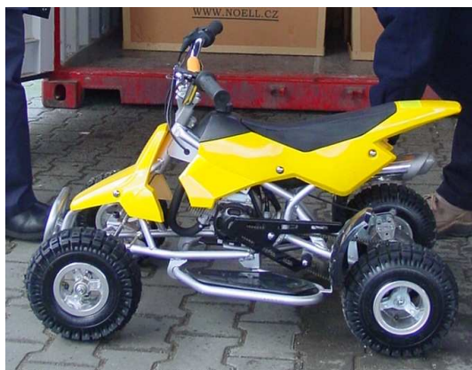
Nedovolená napodobenina – zadrženo na Slovensku