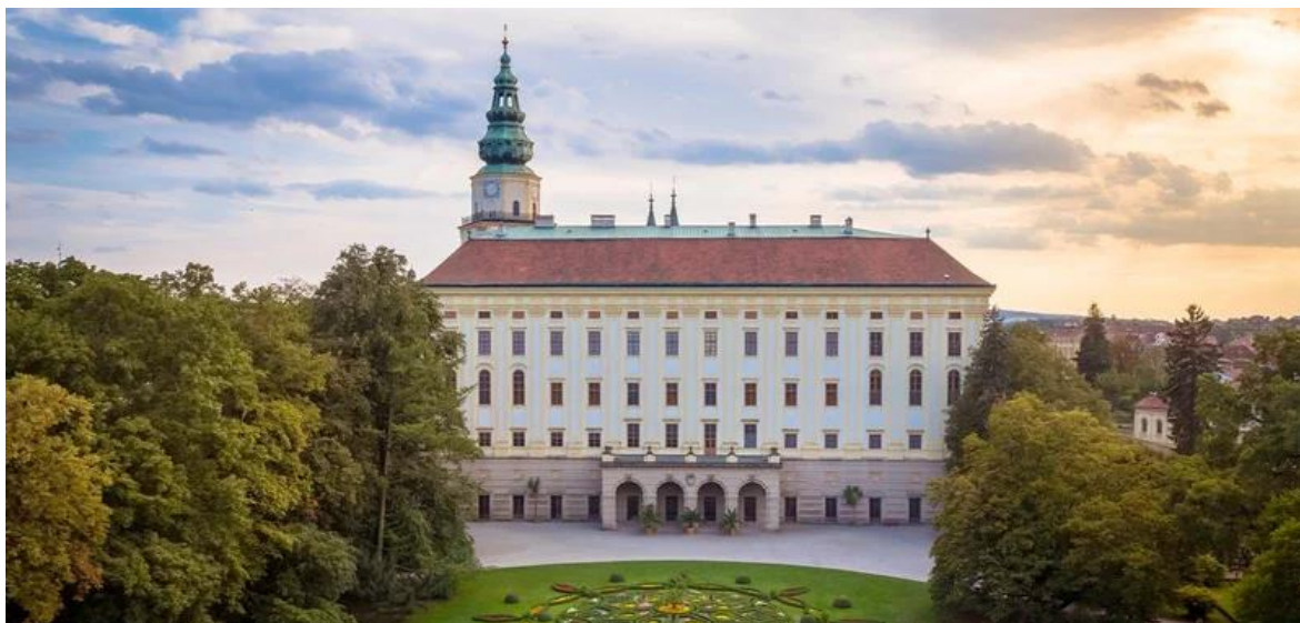
Obrázek 3 - Zámek Kroměříž