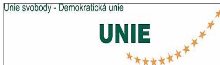
Obr 6. Logo Unie svobody