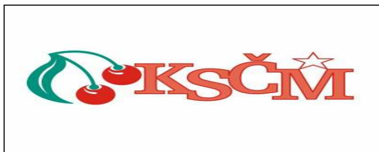
Obr 5: Logo KSČM

Jedna z jej priorít, pri ochrane ŽP, je zvýšenie stability ekosystému a zlepšenie legislatívy, ale iba pokiaľ zmena povedie k zlepšujúcemu sa stavu životného prostredia. Chce zabezpečiť garanciu práva občana dozvedieť sa o ekologických dopadoch stavieb v ich okolí a právo zúčastniť sa na správnom konaní.