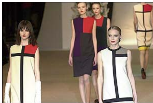
Táto prehliadka vychádza z Y.S.L tradičného štýlu, inšpirovaného Mondrianom (1965)