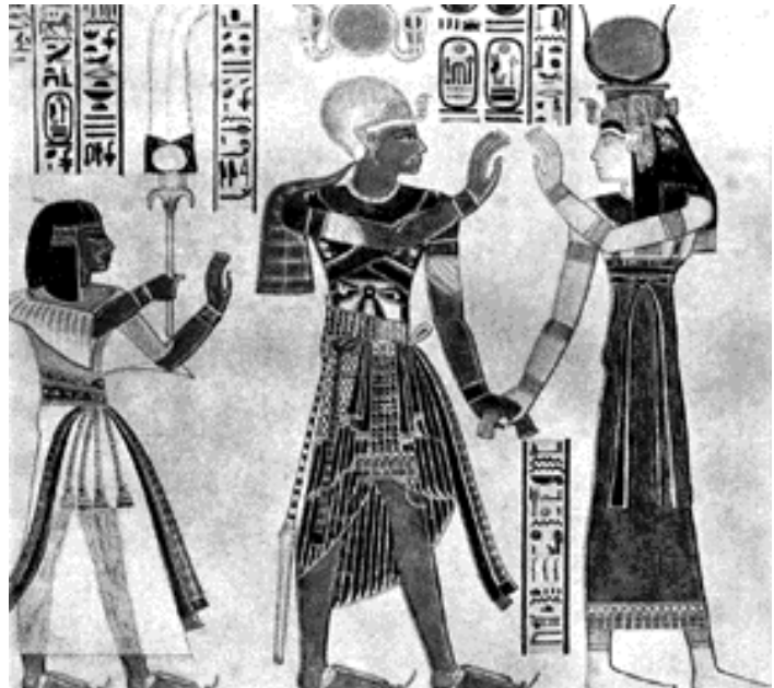
Izis prima Rámessa III. a jeho syna. Dvorný oblek faraónov.