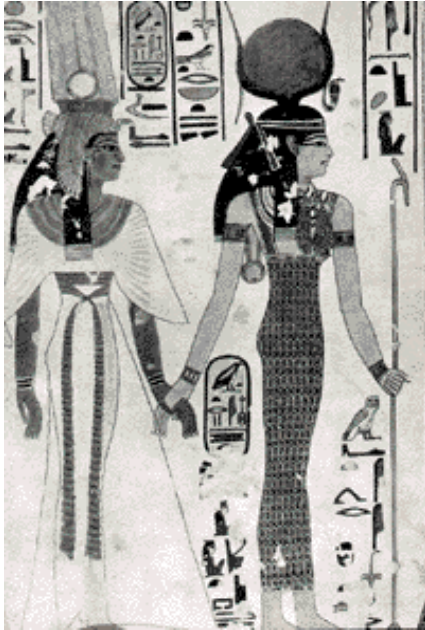
Bohyňa Isis odprevádza kráľovnú Nefertári na onen svet. Maľba v hrobke kráľovny

Pôvodné trojuholníkové tvary zostali, ale namiesto geometrického významu sa stali štylizáciou lotosového kvetu.