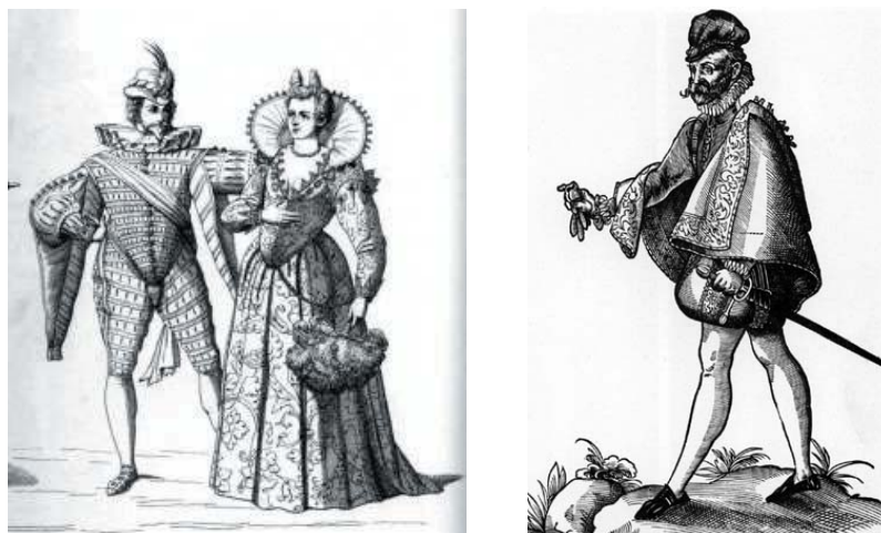
španielsky šľachtic, dvorská móda

Muži sa v tomto období predstavovali vo funkcii rytierskeho dobyvateľa sveta a ženských sídc.