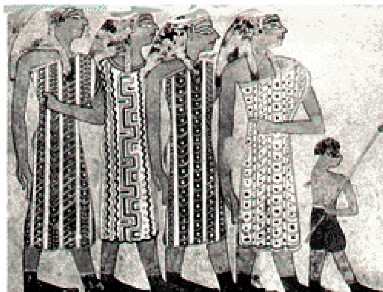
Maľba v hrobke správcu Chnemhotepa. Krátke kalasiris jednoduchého strihu.