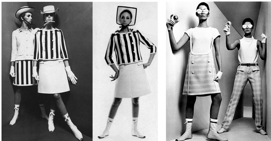
modely André Courrègesa

Ja som si vybrala a spomeniem návrhárov mojej téme blízkych. Módu v týchto rokoch ovplyvnili aj výtvarné smery – hnutia, predovšetkým op – art, propagovaný geometrizujúcimi tendenciami Viktora Vasarelyho. Geometriu využíva, prevažne v potlači materiálu, v menšej miere strihovo André Courrèges. Využíval štvorce, trojuholníky a lichobežníky.