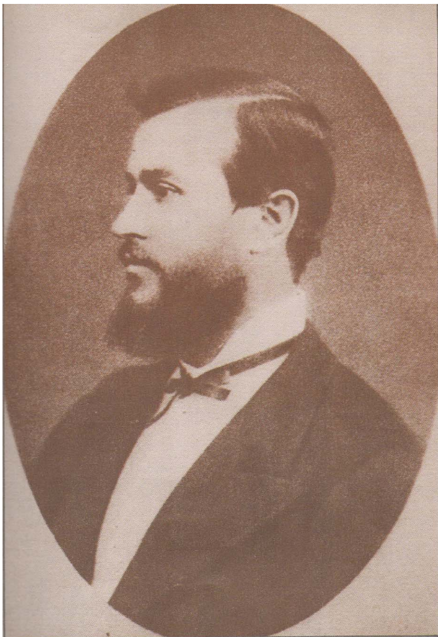
T.G.Masaryk jako suplent latiny a řečtina na gymnáziu ve Vídni 1877