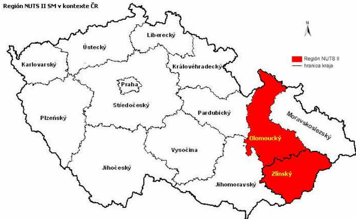
Obr.3 Geografické vymedzenie regiónu NUTS II Stredná Morava [11]

Región Stredná Morava sa nachádza vo východnej časti Českej republiky. Z veľkej časti je hraničným územím. Zdieľa spoločné hranice na severe s Poľskom a na juhu so Slovenskou republikou. Zaberá plochu 9 230 km 2 , na ktorej je 1 230 000 obyvateľov.